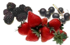
Arômes de fruits rouges

MAISON MILHADE – Domaines & Châteaux - 33570 Lussac Tel : + 335-57-55-48-90 – Fax : 335-57-84-31-27 – www.milhade.fr