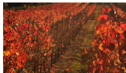
Vignoble cépage Carménère