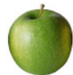
Arômes de Pomme Verte