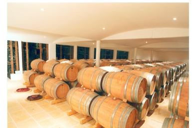
Chai à Barriques du Château Recougne

Robe: Or pâle, reflets brillants Nez: Forte intensité aromatique, citron vert, herbes