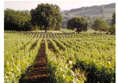
Vignoble du Château Recougne