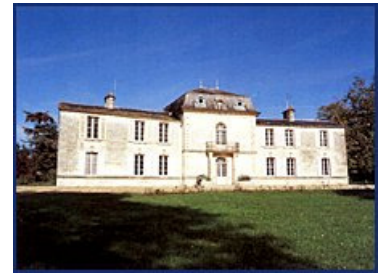
Le Château Recougne