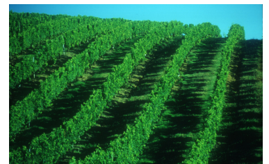
Weinberg in Château Recogne