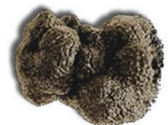
Aromen von Trüffeln