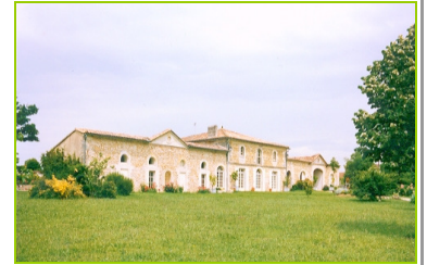
Weingut Château Damase