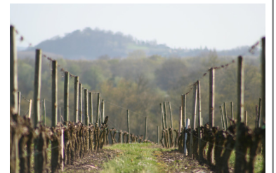
Weinberg mit dem Hügel Tertre de Fronsac