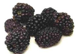
Aromen von roten Beeren