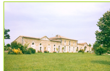
Le Château Damase