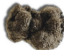
Arômes de Truffe