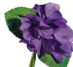
Arômes de Violette