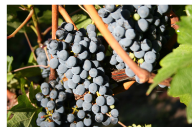
Grappes de Merlot à maturité